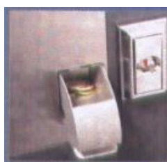
Ritorno moneta di sicurezza