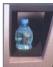
Bocchetta prodotto anti-vandalico con sistema sicurezza