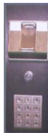
Introduzione moneta di sicurezza + tastiera anti-vandalico (optional)