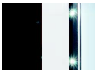
POWER LED AD ALTA POTENZA ILLUMINANTE