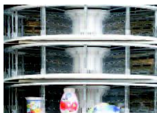
SPORTELLI CHIUSURA APERTURA AUTOMATICI